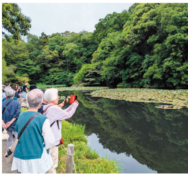
南池に広がる睡蓮を写真に

は、1920年に創建されたようですが、東京大空襲で焼失して、1958年に再建されたそうです。ちょうど目の前を結婚式の行列が進んできて、参拝客に取り囲まれ、めでたい気分になりました。次に、清正の井戸に行きました。井戸につくまでに30分かかりました。小さい井戸でしたがきれいな湧水が湧き出ていました。その次は花菖蒲田で、紫色・白色・ピンク色など咲き誇っていてきれいでした。