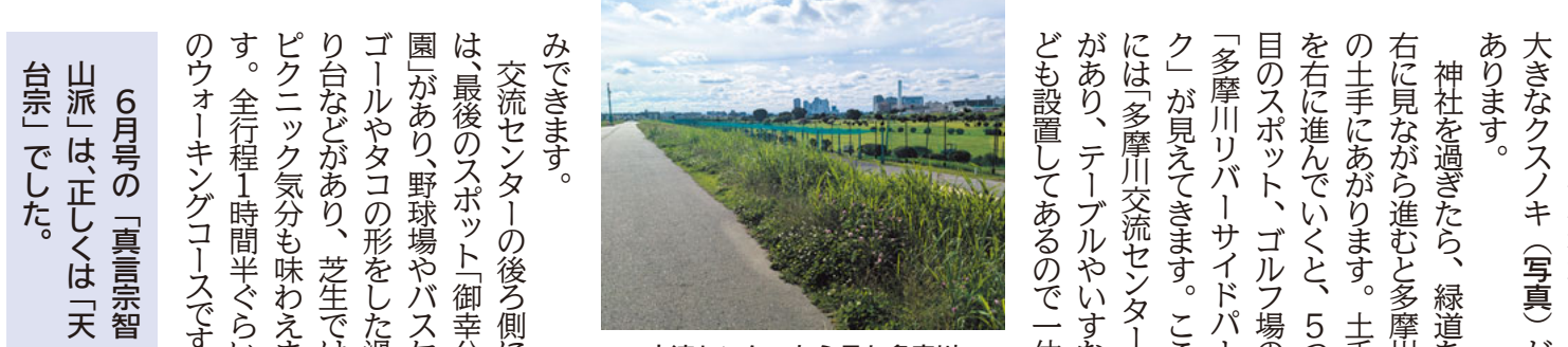
交流センターから見た多摩川

東西に約31km、南北に約19km。東京と横浜に挟まれた東西に細長い川崎市は、内陸の北側と海側の南では街の風景もかなり違います。そんな川崎の知られざる見どころを紹介いたします。今回は、川崎市が各区ごとに作成しているウォーキングマップから、幸区の「鹿島田から御幸公園」までのウォーキングコースを紹介いたします。 編集委員会 スタート地点のJR南武線「鹿島田駅」から多摩川方面に歩き、接骨院と遊技場の間の道へ右折します。道なりに歩いて行くと、右側に最初のスポット「称名寺」が見えてきます。 このお寺には、忠臣蔵で有名な赤穂浪士四十七士が描かれた掛け軸が所蔵されており、吉良邸へ討ち入りした12月14日に一般公開されるそうです。寺の斜め向かいには、 第2のスポット「春風公園」があります。住宅に「下平間」の交差点を右に曲がってまっすぐ行き、「第6児童公園前」交差点を右折すると、第3のスポット「古市場コミュニティ道路」です。この道は昔、多摩川も流れていた場所で、用水路として使われていた跡地に作られました。コミュニティ道路をしばらくまっすぐ進むとバス通りに出ます。バス通りを渡ると右側に、4つ目のスポット天満天神社があり、境内には市の保存樹木である大きなクスノキ(写真)があります。 神社を過ぎたら、緑道を右に見ながら進むと多摩川の土手にあがります。土手を右に進んでいくと、5つ目のスポット、ゴルフ場の「多摩川リバーサイドパーク」が見えてきます。ここには「多摩川交流センター」があり、テーブルやイスなども設置してあるので一休みできます。