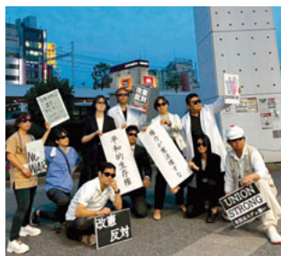
マネキンモブのメンバー

川崎医療生協や、神奈川土建、川崎建築労働組合連合会、川崎合同法律事務所、その他川崎市内に在勤や在住する有志が集まって「改憲反対 音楽デモ」が、6月16日川崎駅東口で行われ、1000人ほどが集まりました。