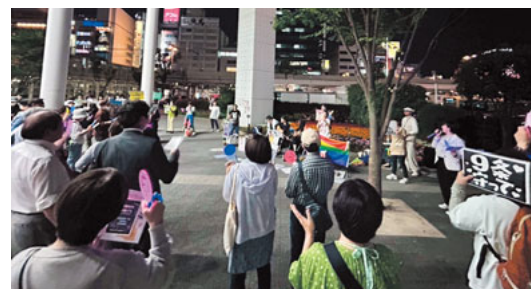
106人が集まった川崎駅前

音楽デモの前には、平和をアピールする看板を持ちながら、マネキンのように体を動かさず、道行く人々にアピールする「マネキンモブ」が行われました。その後、生演奏をバックに、「戦争反対!」や「改憲反対!」を集まった人と一緒に声にしました。また、「デモ隊は、憲法前文や、川崎市の『核兵器廃棄平和都市宣言』を朗読し、今の憲法の大切さや、武力ではなく対話による平和外交を望んでいることを、街ゆく人に訴えていました。