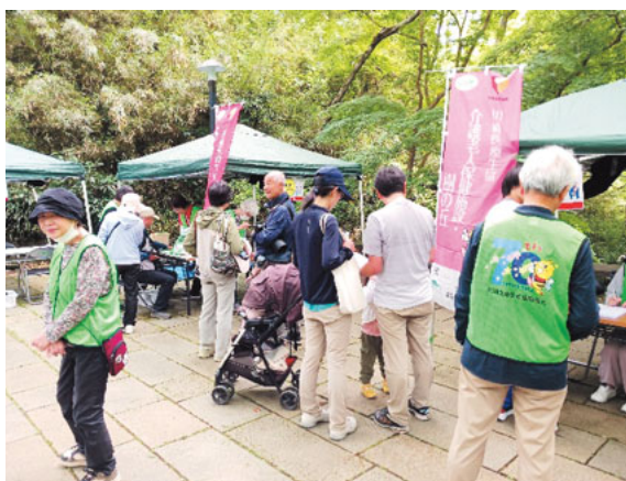
子どもから高齢者までが参加

6月6日、多摩区の生田緑地で行われた「青空フェスタin生田緑地」に今年も川崎医療生協が健康チェックとモルック体験で参加しました。全体の来場者は4750人で、にぎわいのあふイベントになりました。川崎医療生協のブースでは、血圧や、握力、棒反射、ペットボトルキャップつかみ大会、モルック体験などを行いました。青空フェスタでは初めて「ベジチェック」という、どれだけ野菜がとれているかわかる機械を持ち込みました。ベジチェックには122人が参加するなど全体