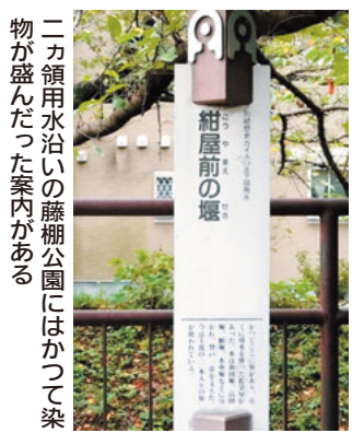
二方領用水沿いの藤棚公園にはかつて染物屋が盛んだった案内がある