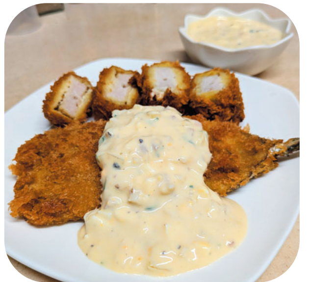
1人分110kcal.タンパク質約9.0g

♥一口メモ: エビフライにかけてもよし、揚げ鳥りにかけてもよし、お好みで色々なものにかけて食べてください