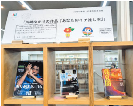
リーフレットの本が読めます

高津図書館では、入り口付近に職員と職員の子どもの親子が、休みの日に神奈川県だけでなく東北まで出かけて採取してきた、かぶと虫やくわがた虫の展示コーナーがあり、ふだんはあまり見ることができない、かぶと虫やくわがた虫を展示して、関連する本を一緒に展示してあります。また、開催期間中の土日は、かぶと虫やくわがた虫とふれあえる時間もあります。