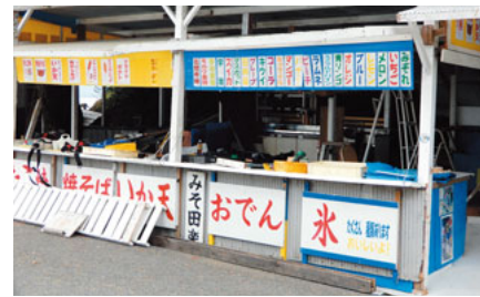
徳島県阿南市、北の脇海水浴場で

小さな島々があり、海に囲まれた日本列島の海岸線は、リアス式海岸が多く見てもわかりますが、北海道でもいくつも海水浴場はあるし日本全国海水浴場だらけといってもいいはずです。