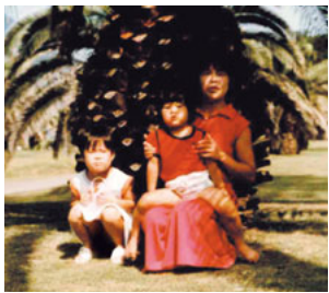
家族の待つ鹿児島へ

夕方早めに仕事を終えて自宅までシャワーを浴びて、早速、車で鹿児島までのドライブのスタートです。インターネットはもちろんナビもない時代に、よくもこんな計画を