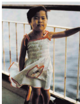
帰りはカーフェリーで

九州自動車道に入れば鹿児島までおよそ400キロ。当時は熊本県八代市で九州自動車道は終わっていたので、その先は、海岸線を走る国道3号を走り、「公害の原点」ともいわれている水俣市を