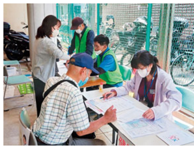
にぎわう健康チェック

6月12日、ふじさきクリニック駐輪場で、健康チェックを池上新町支部主催で開催しました。入り口に健康チェックののぼり旗を立てるやいなや測定希望者がきました。測定希望者が次々に来て休む間もなく、合計36人の健康チェックを行いました。健康チェックはまず体組成チェックから始まり、参加者に靴下を脱ぐように促し、体組成の機械の上に乗ってもらい測定します。その次は、足の筋肉のチ